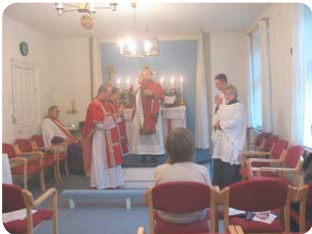
Lises prima missa

Så fik vi en kvindelig præst mere i Danmark.